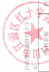
部门一般公共预算拨款基本支出预算明细表