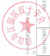
部门收入总体情况表