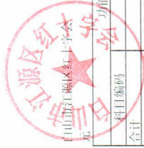
一般公共预算支出情况表